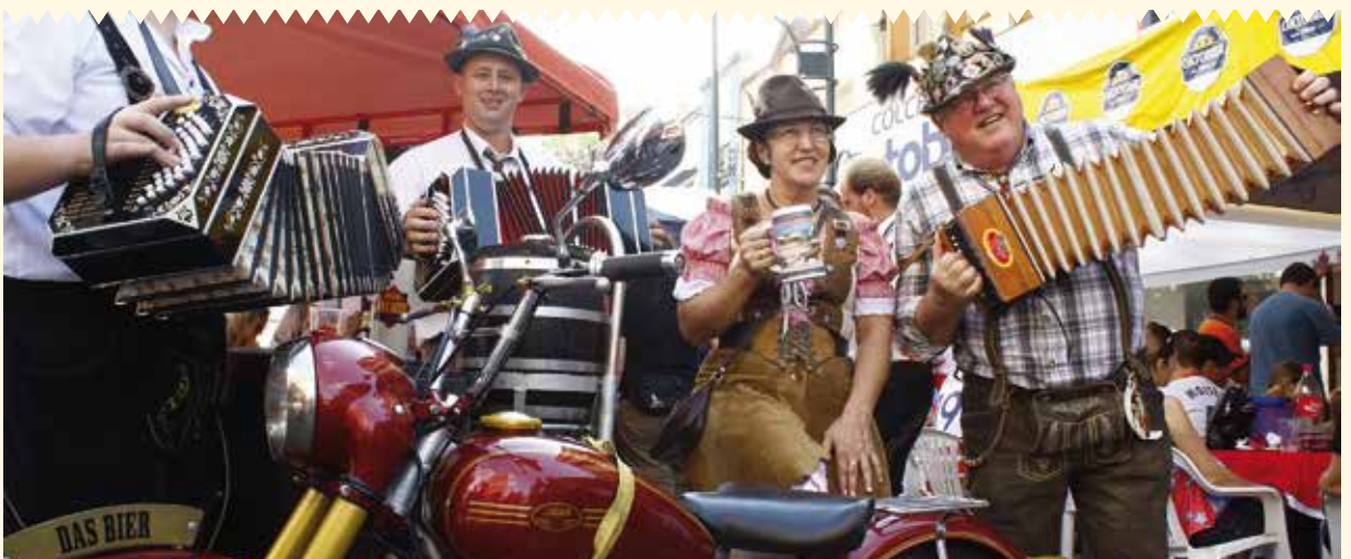
Choppmotorrad desde Blumenau, Brasil