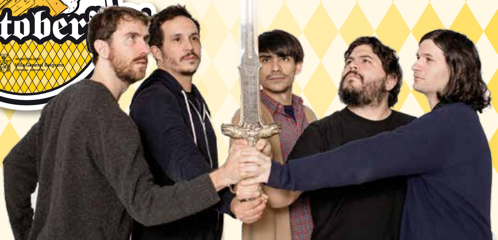
El Mató a un Policia Motorizado