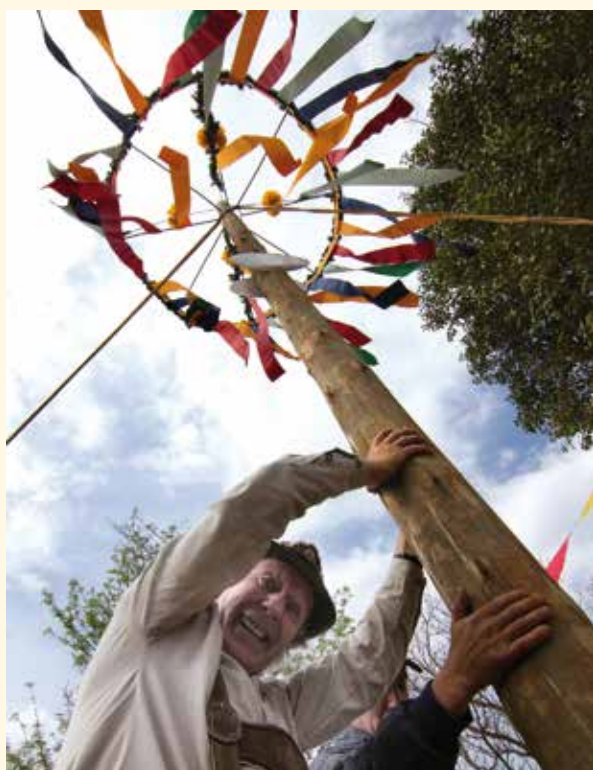
Ceremonia del Plantado del Maikranz